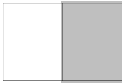
Helside: 225mm x 280mm + 3 mm til kant: Pris: 55.000 kr.